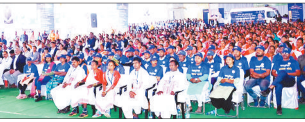
वीडियो कॉन्फ्रेंस के माध्यम से बात करते पीएम।

जशपुरनगर। दूर घने जंगलों में रहकर कभी घासफूस के आशियानों में कभी बारिश तो कभी तूफानों को सहने वाले कभी अंधेरे में सांप बिच्छू के साथे में दहशत से रात काटने वाले और कभी स्वच्छ पानी सहित बीमारियों से दूर कभी सोचा भी नहीं था कि एक दिन उनके परिश्रमी हाथों-सिर पर वह माइक्रो-माइक्रोफोन भी आएगी जिससे वह देश के प्रधानमंत्री नरेंद्र मोदी से संवाद स्थापित कर अपनी जिंदगी के कठिन सफर को सरल बनने और जीवनशैली में आए बदलाव को बयां कर पाएगी। जिले के बगीचा तहसील