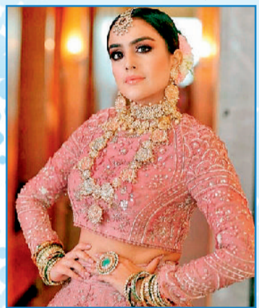
ठंड से बचाने में हेल्पफुल फुल स्लीव्स ब्लाउज

हालांकि इन दिनों फिर से फुल स्लीव्स ब्लाउज का फैशन जोर-शोर से लौट आया है, लेकिन फैशन को फॉलो ना करें तो भी जब सर्दियों में शादी हो रही हो, तो आप स्लीवलेस या हाफ स्लीव्स के बजाय, फुल स्लीव्स ब्लाउज को ही चुनें। इससे सर्दी से भरपूर बचाव होगा। यह दिखने में भी बहुत अच्छे लगते हैं। हाल के सालों में कियारा आडवाणी जैसी न्यू जेनरेशन