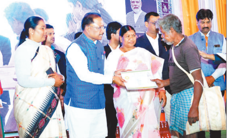
हिताग्रहियों को प्रमाण पत्र वितरित करते मुख्यमंत्री।

प्रधानमंत्री नरेंद्र मोदी जरूरतमंद परिवारों के लिए जो योजनाएं तैयार करते हैं, उसका प्रभावी क्रियान्वयन भी सुनिश्चित करते हैं। सबका साथ, सबका विकास, सबका विश्वास के साथ सबके प्रयास को शामिल करते हुए आगे बढ़ते हैं। उन्होंने विशेष पिछड़ी जनजाति को आगे बढ़ाने के लिए प्रधानमंत्री जनमन योजना लाई है। इसके माध्यम से हम इस वर्ग के समग्र विकास के लिए कार्य करेंगे। यह बात मुख्यमंत्री विष्णु देव साय ने प्रधानमंत्री जनमन योजना अंतर्गत तहसील बगीचा के कार्यक्रम को संबोधित करते हुए कही। मुख्यमंत्री श्री साय ने जशपुर जिले में पीएम जनमन योजनाओं के क्रियान्वयन तथा अन्य जानकारी साझा करते हुए बताया कि यहां पहाड़ी कोरवा के 288 बसाहटों में 3761 परिवार और 16 हजार 629 जनसंख्या निवास करते हैं। इसी तरह जशपुर जिले में बिरहोर जनजाति 12 बसाहटों में 177 परिवारों और 565 जनसंख्या के साथ निवास करते हैं। उन्होंने बताया कि भगवान बिरसा मुंडा जी की जयंती दिवस 25 नवम्बर 2022 को पीएम जनमन योजना लागू की गई है। 3 साल तक