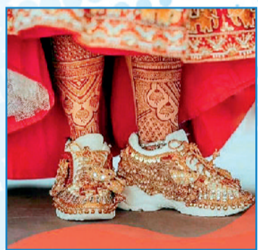
मैचिंग बूटीज से मिलेगा कंप्लीट लुक

मौके के लिए जो स्पेशल वेडिंग ड्रेस बनवाएं, कोशिश करें वो सिल्क, वेलवेट या वुलेन मिक्स कॉटन की हो। इन फैब्रिक में हर तरह के डिजाइन खूबसूरती से उभरती हैं और ये सर्दी की रातों में आपको वार्म फीलिंग देंगी।