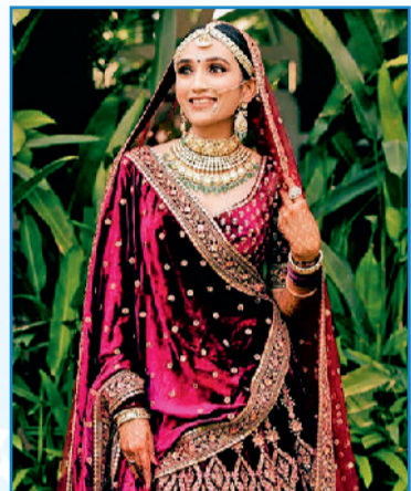
गार्जियस लुक के लिए कैरी करें वुलेन स्टॉल

अपनी शादी तक ही सीमित ना रखें, अगर इन दिनों अपने फ्रेंड या रिसेप्टिव की शादी फंक्शन में शरीक होना हो और देर रात तक वहां रुकना हो, तो ऐसे मौके पर भी वार्म फैब्रिक ड्रेस से ही पहनें। रात में होने वाली रस्मों में देर तक अकसर खुले आसमान के नीचे बने मंडप में या हल्की सी छांव में बैठना होता है, इसलिए इस